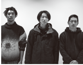
hyslom (現代美術, パフォーマンスアート)